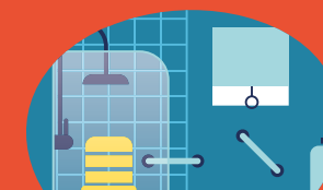
Aménagement de la salle de bain (douche à l'italienne, lavabo PMR...), WC surélevé, barre d'appui