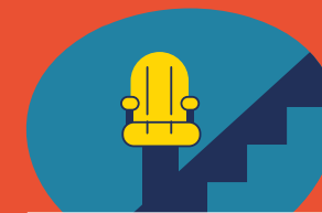
Monte-escalier intérieur et/ou extérieur